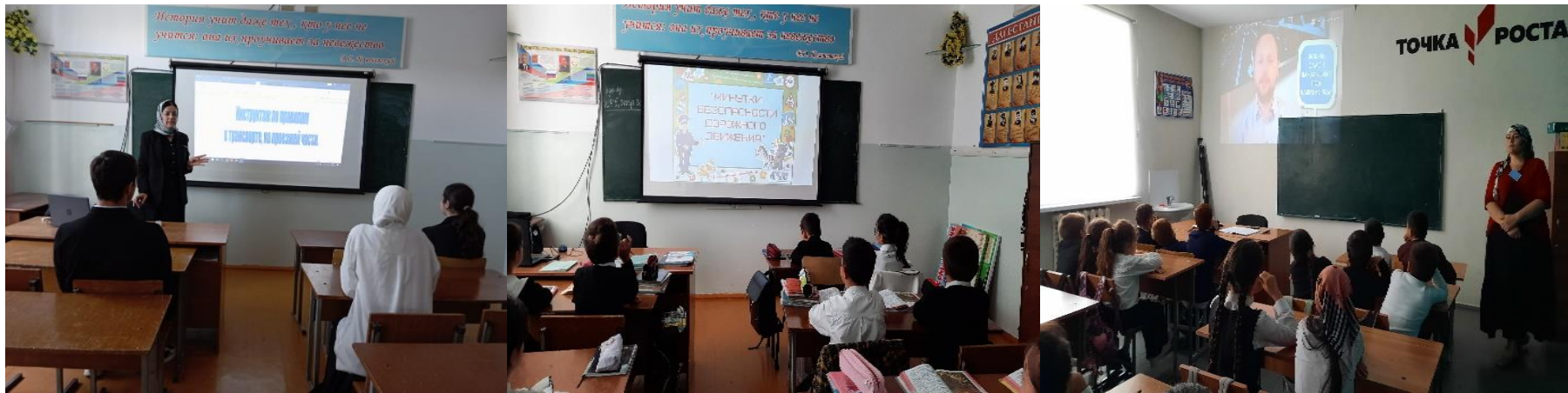
8. Проведение уроков по БДД в рамках предметов «Окружающий мир» и ОБЖ в 1 -9 классах .