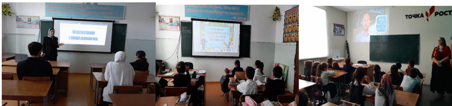
Проведение уроков по БДД в рамках предметов «Окружающий мир» и ОБЖ в 1 -9 классах . Охвачено 123 обучающихся