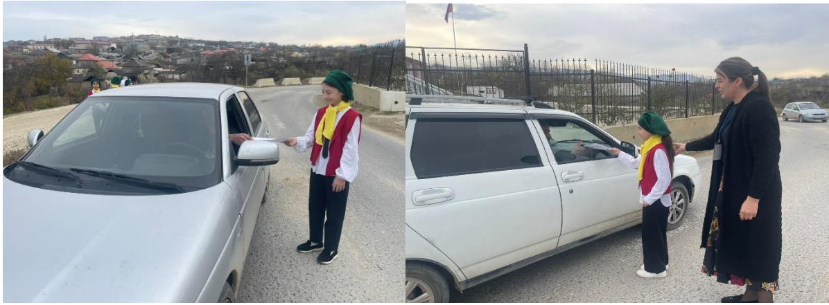
Линейка, посвященная «Всемирному дню памяти жертв ДТП»