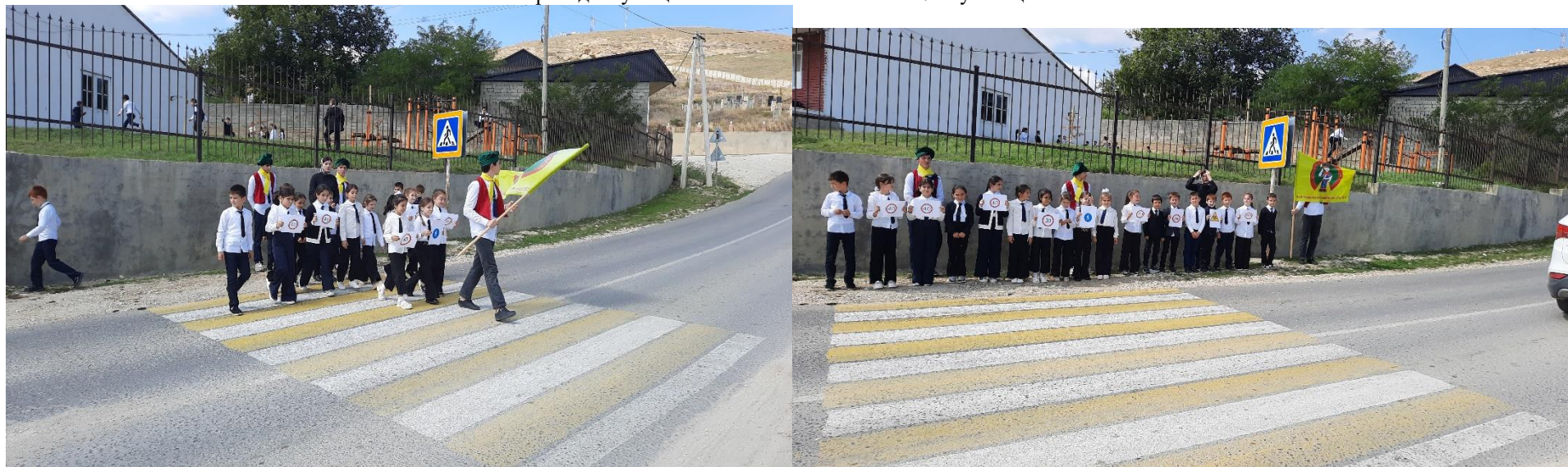
12.09.2023года классные руководители 1-2 классов провели игры на правила дорожного движения .Охвачено 30 учащихся.